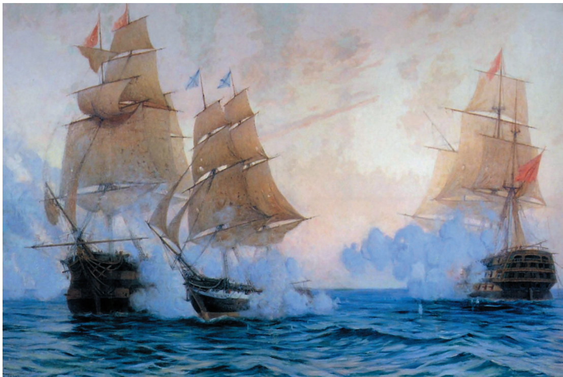
Брик «Меркурий». Большой подвиг маленького корабля

водец. Он участвовал 8 октября 1827 г. в знаменитом Наваринском сражении объединенного флота России, Англии и Франции против турецко-египетского флота. Сражаясь одновременно с пятью турецкими кораблями, «Азов», уничтожил четыре, а пятый, 80-пушечный линейный корабль под флагом командующего неприятельским флотом, заставил выброситься на мель. В этом бою особенно отличились офицеры «Азова» лейтенант П.С. Нахимов, мичман В.А. Корнилов и гардемарин В.И. Истомина. Из 600 человек экипажа «Азова» 153 были убиты и ранены. В корпусе «Азова» насчитали потом 153 пробоины, в том числе семь подводных. Но героический линейный корабль не