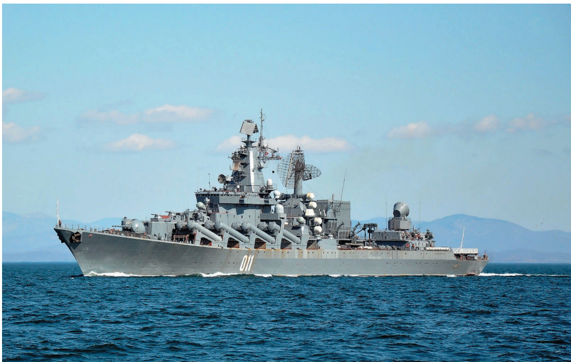
Гвардейский ракетный крейсер «Варяг»

9 ноября 2010 года корабль прибыл с неофициальным визитом в южнокорейский порт Инчхон. На него была возложена историческая мис-